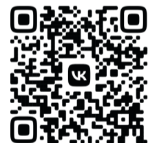
ВидеOVERсия ТК «СвиРьИнфо»

В России 2 августа отмечают свой профессиональный праздник «Войска дяди Васи». Такое уважительное прозвище имел Герой Советского Союза Василий Маргелов, возглавлявший военно-воздушные войска на протяжении более двух десятков лет. Интересно, что первые десантные части в СССР были сформированы ещё в 1931 году, однако лишь спустя 60 лет воздушно-десантные войска обрели свой современный