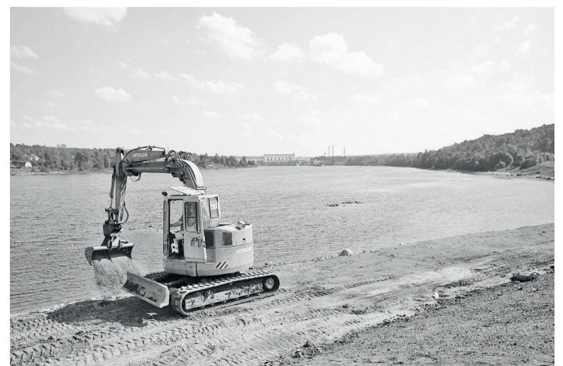
► Ведутся работы по прокладке сетей и дренажа

этим последовало и строительство дороги на Петрозаводск, которое в ещё большей степени стимулирует экономические возможности нашего района. Трасса сократит путь в Петрозаводск на сто километров! Правда, без федеральной поддержки тут не обойтись. Не стоит забывать и о ремонте автодороги на Ошту в Вологодскую область. Всё это позволит многократно увеличить трафик и положительно отразиться на привлекательности для бизнеса в Присвирье.