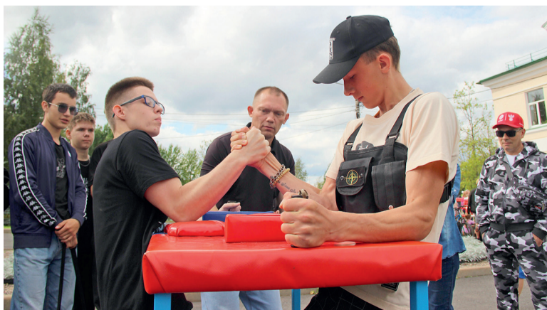
Соревнования по армрестлингу