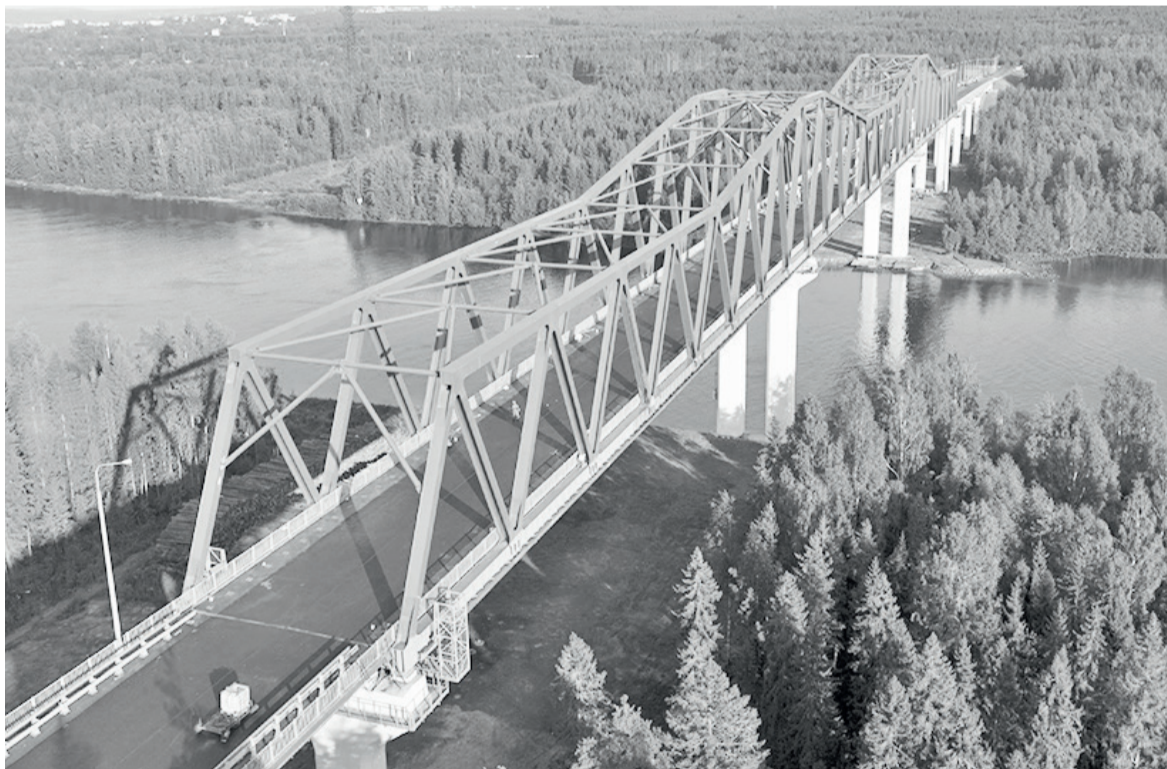
► На мосту завершена укладка асфальтного покрытия

строительства долгожданного моста через Свирь. Сейчас там ведутся работы в завершающей стадии. Однако мы смотрим на перспективу, хочется, чтобы за