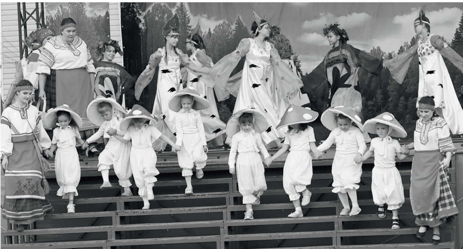
► Фестиваль «Древо Жизни» – визитная карточка района

Важное значение, как всегда, имеет подготовка к новому учебному году. В школах и детских садах идут текущие ремонты. Особое внимание уделяем школе № 4, которой необходима реновация. Подготовлен проект, он предусматривает сохранение прежнего исторического здания.