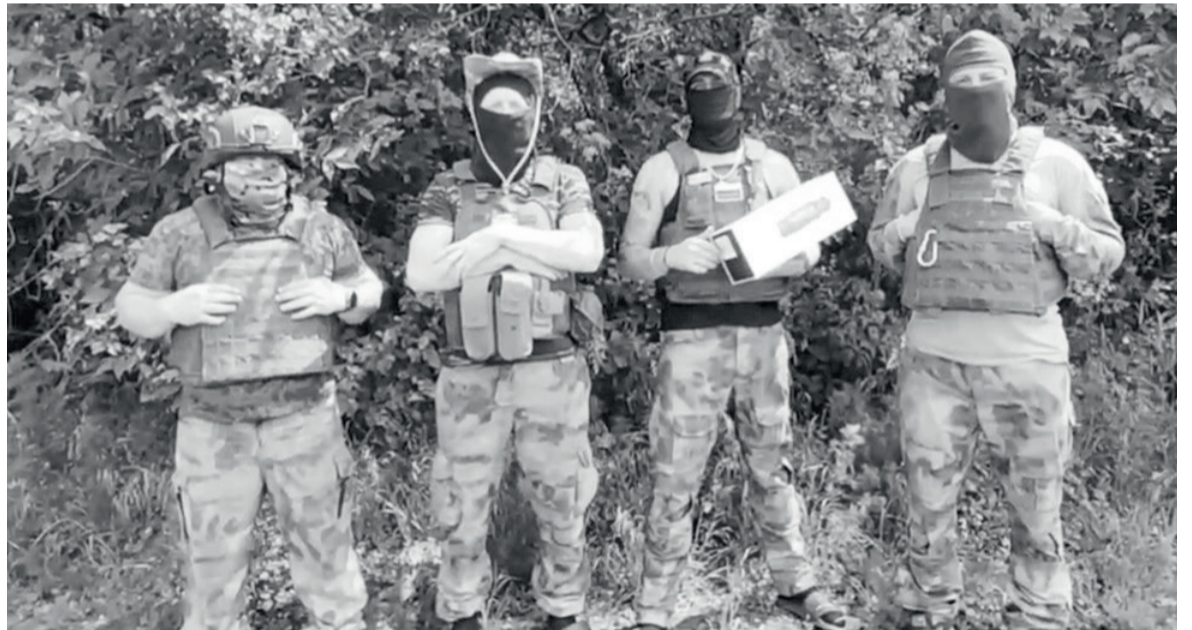
► Земляки, бойцы СВО благодарят за помощь всех, кто их поддерживает и ждёт

Важным считаю сохранить эту благоустроенную территорию в дальнейшем, для этого думаем