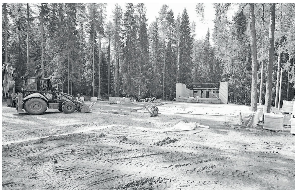
► Парк – новое место притяжения для горожан и гостей района

Кроме того, привлечение средств в район позволяет решать насущные проблемы. Возьмём наши дворы. В этом году по договорённости с местным Советом депутатов удалось изыскать финансирование для благоустройства четырёх дворовых территорий, хотя сначала планировалось только две. При этом следует обратить внимание,