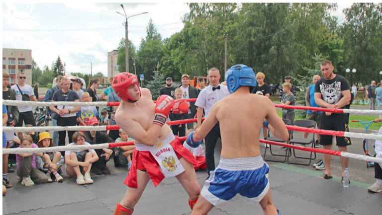
Поединок на площадке клуба «Исток»