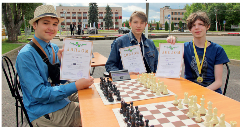
Призёры blitzтурнира по шахматам