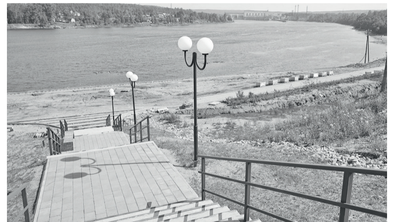
► Будущая набережная на Свири

свою работу, но понимания со стороны собственника предприятия пока не находим. Он ориентирован на ликвидацию комбината путём продажи. В результате люди окажутся без работы. В отношении продовольственной обеспеченности мы сумели подстраховаться, потребители не почувствуют изменений, предусмотрено заключение дополнительных контрактов с новыми поставщиками по обеспе-