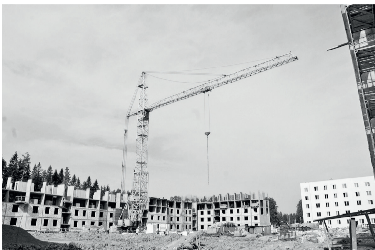
► Строительство домов на Кирова – полным ходом

Кроме того, на новых канализационно-очистных сооружениях началась итоговая проверка. Надеемся, что в сентябре-октябре уникальный по технологическим решениям объект начнёт функционировать, что положительно отразится на чистоте сточных вод и экологии нашей Свири. Готовимся к вводу детской поликлиники, куда