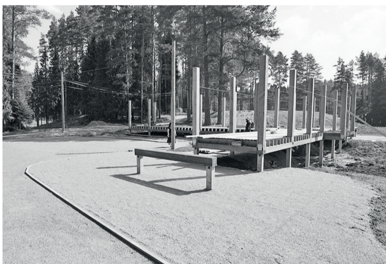
► В городском парке появляются новые конструкции для отдыха

В ноябре надеемся на передачу ещё двух многоквартирных домов по программе переселения из аварийного жилья. Таким образом, у нас остаётся построить последний дом на проспекте Кирова, в рамках запланированного. Кстати, строители уже начали его возводить, поэтому ожидаем, что к июню