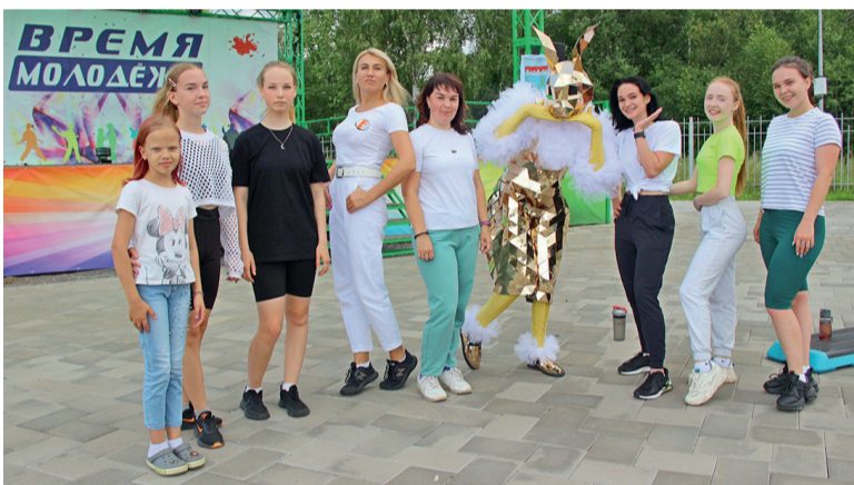
Самые активные и спортивные девушки нашего района

В 16 часов гости праздника приняли участие в детской игровой программе с конкурсами, танцами и весёлым играми от Фиксиков, которую подготовили сотрудники Подпорожского культурно-досугового комплекса. Практически весь день юных подпорожцев развлекали сотрудники местного центра «БадаБум». Дети и взрослые с удовольствием фотографировались с яркими сказочными героями и проходили интеллектуальные квесты.