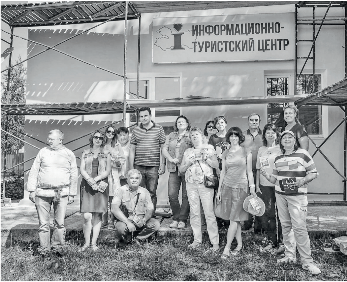
► Туристы в ожидании новых впечатлений

привлечь не только коммунальные службы, но и малый бизнес. Торговые и прокатные павильоны будут предоставляться социально ответственным партнёрам. Верю, что городской парк останется излюбленным местом отдыха подпорожцев и зимой, и летом.