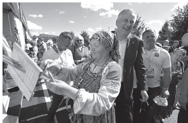
Выставка ремёсел стала изюминкой праздника в Тосно

Впрочем, ленинградцы умеют не только хорошо работать, но и весело отдыхать. Это доказал многочасовой концерт