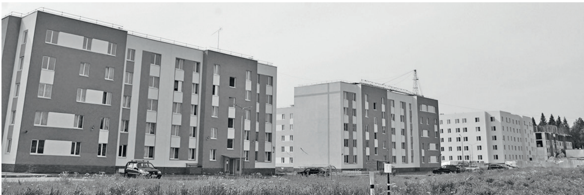
► Ещё два многоквартирных дома планируют сдать в ноябре

– Можно ли приподнять завесу тайны с благоустройства городского парка? Многие горожане сетуют, что не понимают, что там планируется сделать.